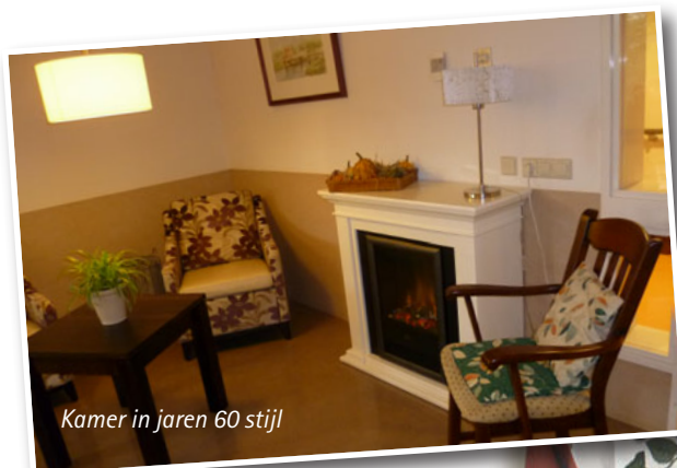
Kamer in jaren 60 stijl

Op het entertainmentvlak zorgden we voor 16 optredens op verschillende locaties met een show van Saskia Pearl.