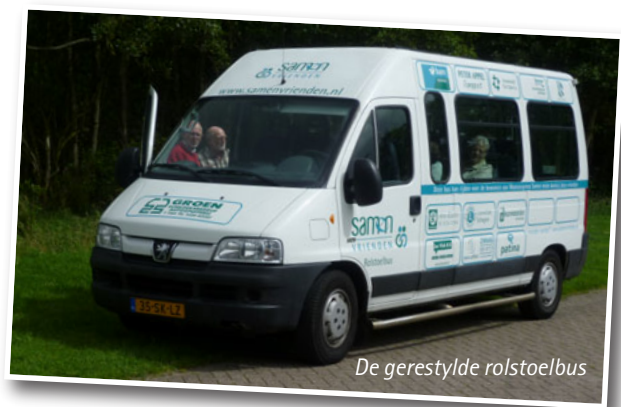
De gerestylede rolstoelbus

Ook in het afgelopen jaar heeft de Stichting Samen Vrienden diverse activiteiten georganiseerd om gelden bij elkaar te sprokkelen waarmee activiteiten bekostigd kunnen worden om het leven van de bewoners van alle locaties van de Woonzorggroep Samen te kunnen opfleuren.